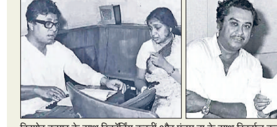
किशोर कुमार के साथ रिकॉर्डिंग करतीं और पंचम दा के साथ रिहर्सल करतीं आशा भोसले।