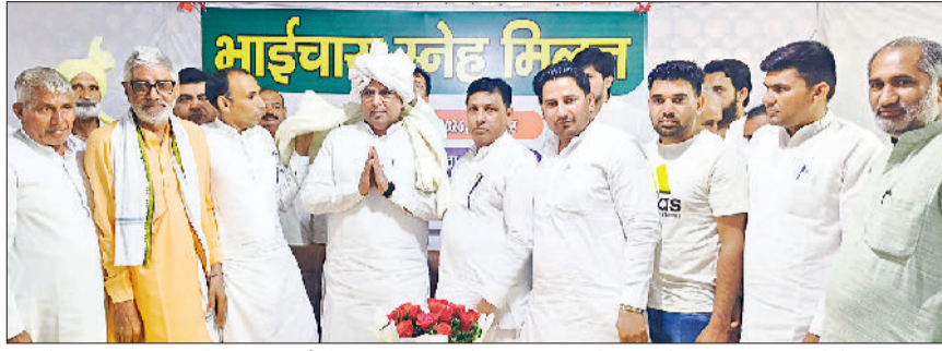
कुरुक्षेत्र। जाट धर्मशाला में पूर्व वित्त मंत्री कैप्टन अभिमन्यु को सम्मानित करते प्रबुद्ध लोग।