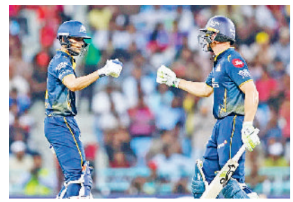
गुजरात की दूसरी जीत, लखनऊ डेर बटलर-गिल की फिफ्टी, कृष्णा का कहर