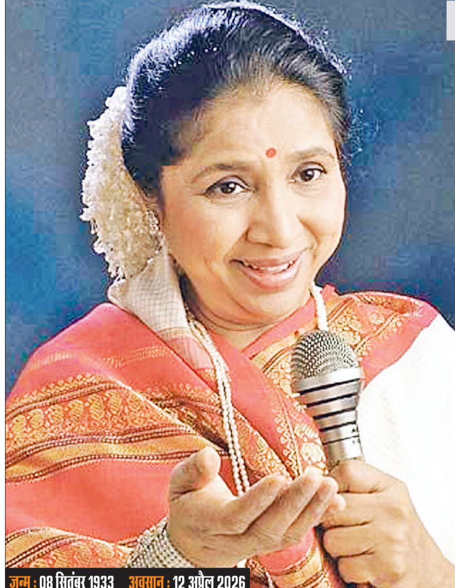
जन्म : 08 सितंबर 1933 अवसान : 12 अप्रैल 2026

से निकाल दिया गया कि उनकी आवाज खराब है। लेकिन बाद में वे भारतीय संगीत की एक ऐसी जादुई आवाज बनीं जिन्होंने 8 दशकों से अधिक समय तक करोड़ों दिलों पर राज किया है। आज दुनियाभर के कई होटलों की मालकिन आशा का बचपन गरीबी में बीता। तंगहाली का आलम यह था कि फीस नहीं होने के चलते उन्हें स्कूल से बाहर निकाल दिया गया था।