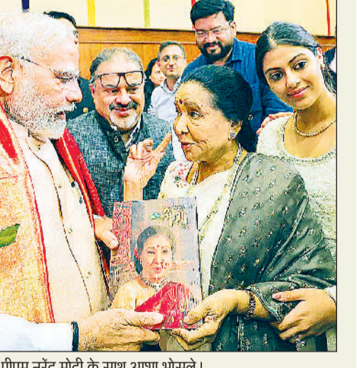
एक कार्यक्रम के दौरान पीएम नरेंद्र मोदी के साथ आशा भोसले।