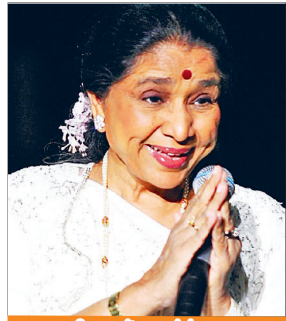
आइडियल थीं लता मंगेशकर