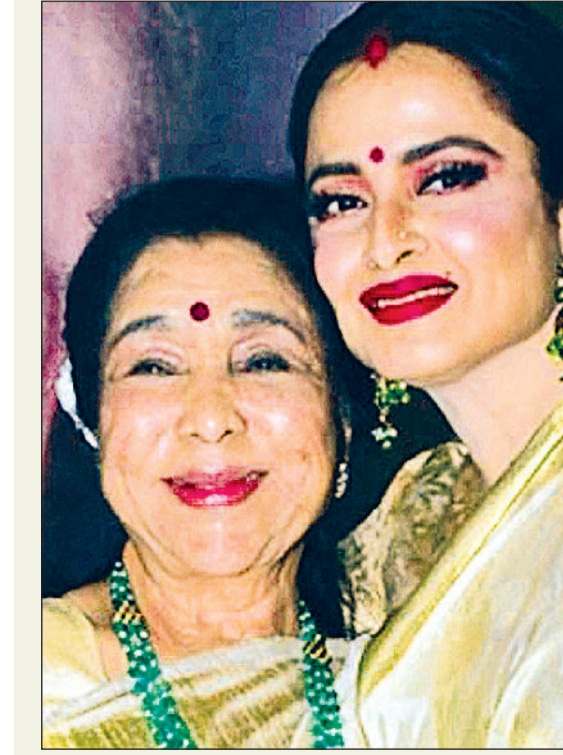
बॉलीवुड अभिनेत्री रेखा के साथ आशा भोसले।

आशा भोसले का जन्म 8 सितंबर 1933 को महाराष्ट्र के सांगली में हुआ था। वह प्रसिद्ध शास्त्रीय गायक पंडित दानानाथ मंगेशकर की बेटी थीं। घर में संगीत का माहौल शुरू से ही था। उनके भाई-बहन लता मंगेशकर, मीना खंडीकर, उषा मंगेशकर व हृदयनाथ मंगेशकर भी संगीत की दुनिया से ही जुड़े रहे। जब आशा सिर्फ 9 साल की थीं, तब 1942 में उनके पिता दानानाथ मंगेशकर का निधन हो गया। इससे परिवार पर आर्थिक संकट आ गया। परिवार को सहारा देने के लिए लता और आशा ने कम उम्र में गायन शुरू किया।