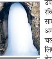
गुफा में पहली पूजा 19 जून को च्येष्ठ पूर्णिमा पर होगी

श्रीनगर (एजेसी) । अमरनाथ यात्रा की तारीखों का ऐलान कर दिया गया है। जम्मू-कश्मीर के उपराज्यपाल मनोज सिन्हा ने रविवार को बताया कि इस साल यात्रा 3 जुलाई से 28 अगस्त तक चलेगी। 57 दिन चलने वाली इस यात्रा के लिए जम्मू के भगवती नगर बेस कैम्प से पहला जंथा रवाना होगा। यात्रा के लिए रजिस्ट्रेशन 15 अप्रैल से शुरू होगा। एलजी सिन्हा ने बताया कि 13 से 70 साल की उम्र वाले यह यात्रा कर सकते हैं। गुफा में पहली पूजा 19 जून को च्येष्ठ पूर्णिमा पर की जाएगी। यात्रा के लिए अनंतनाग से पारंपरिक 48 किमी लंबा नुनवान-पहलनाम रूट और गांदरबल से 14 किमी लंबा बालटाल रूट खुला रहेगा।