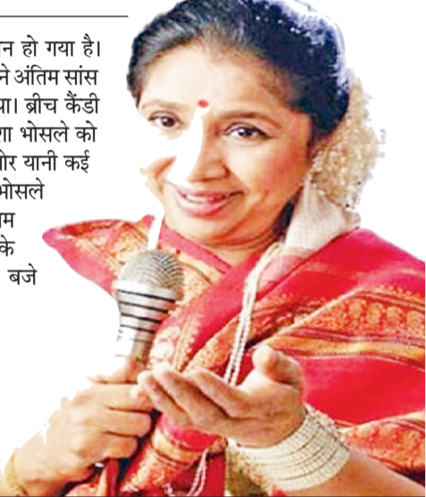
जन्म : 8 सितंबर 1933, निधन : 12 अप्रैल 2026