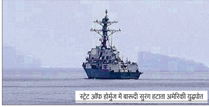
स्ट्रेट ऑफ होर्मुज में बारूदी सुरंग हटाता अमेरिकी युद्धपोत

अमेरिका ने हम पर भरोसा नहीं किया ईरानी संसद अध्यक्ष मोहम्मद बाघेर गालिबाफ ने इस्लामाबाद में हुई बातचीत खत्म होने के बाद अपना पहला आधिकारिक बयान जारी किया है। उन्होंने कहा कि इस दौर की बातचीत में दूसरा पक्ष (अमेरिका) ईरानी प्रतिनिधियों का भरोसा जीतने में नाकाम रहा। गालिबाफ ने कहा कि बातचीत शुरू होने से पहले ही उन्होंने स्पष्ट कर दिया था कि ईरान की ओर से नीयत और इच्छा दोनों मौजूद हैं, लेकिन पिछले दो युद्धों के अनुभवों की वजह से उन्हें दूसरे पक्ष पर भरोसा नहीं है। गालिबाफ ने इस बातचीत को मुश्किल बनाने के लिए पाकिस्तान का ध्वजवाहक किया।