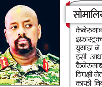
50 साल के कैनेरुगाबा को माना जाता है पिता और राष्ट्रपति योगेरी का संभावित उत्तराधिकारी

एजेसी ►► कर्नाला युगांडा के आर्मी चीफ और राष्ट्रपति के बेटे मुहूजी कैनेरुगाबा ने तुर्किये से 1 अरब डॉलर (9000 करोड़) और देश की 'सबसे खूबसूरत महिला' को अपनी पत्नी बनाने की मांग की। उन्होंने चेतावनी दी कि मांग पूरी नहीं हुई तो तुर्किये से कूटनीतिक संबंध खत्म कर दिए जाएंगे और तुर्किया एयरलाइन पर रोक लगाई जा सकती है। कैनेरुगाबा ने एक्स पर लिखा कि अगर तुर्किये ने हमारी समस्याओं का समाधान नहीं किया, तो 30 दिन में संबंध तोड़ दिए जाएंगे। उन्होंने कहा कि या तो वे भुगतान करें या हम उनका दूतावास बंद कर देंगे। उन्होंने युगांडावासियों को तुर्किये यात्रा से बचने की सलाह दी और इजराइल के समर्थन में 1 लाख सैनिक भेजने की पेशकश की। हालांकि, इस पर तुर्किये की ओर से कोई आधिकारिक प्रतिक्रिया नहीं आई है।